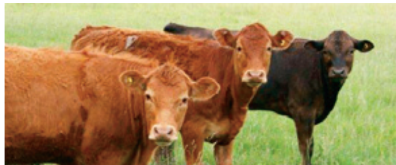
Les étiquettes jaunes de l'ACIB, conçues pour l'industrie du bœuf (vérification d'âge et activation de l'étiquette), servent avant tout à identifier les bêtes quittant la ferme.

ACIA = Agence canadienne d'inspection des aliments