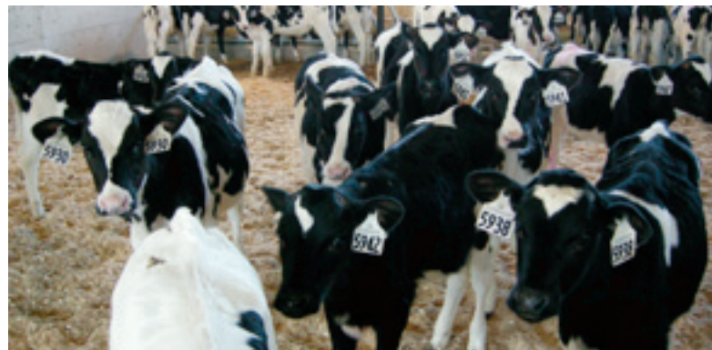
Les systèmes d'étiquetage sécuritaire laitier INBL ou ATQ fournissent une identification à vie qui facilite la régie à la ferme, la vérification d'âge, l'enregistrement, les services de l'industrie et le déplacement hors de la ferme.